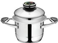
PUODAS Z-1625 Ø 16 cm, 2.5 l, aukštis 12.5 cm Ø 6 ¼ col., 2.65 Qt, aukštis 5 col.