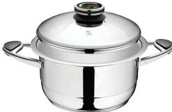
PUODAS Z-2455 Ø 24 cm, 5.5 l, aukštis 12.5 cm Ø 9 ½ col., 5.83 Qt, aukštis 5 col.