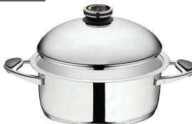
PUODAS Z-V3060 30 x 22 cm, 6 l, aukštis 12.5 cm Ø 11 ¾ col., 6.36 Qt, aukštis 5 col.