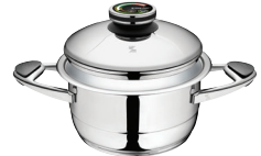
PUODAS Z-2030 Ø 20 cm, 3 l, aukštis 9.7 cm Ø 7 ¾ col., 3.18 Qt, aukštis 3 ¾ col.