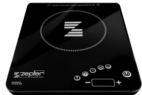
RADJO INDUKCIŲ VIRYKLĖ