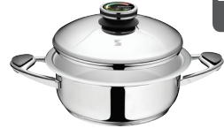
PUODAS Z-2440 Ø 24 cm, 4 l, aukštis 9 cm Ø 9 ½ col., 4.24 Qt, aukštis 3 ¼ col.