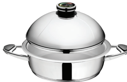
PUODAS Z-2850B Ø 28 cm, 5.0 l, aukštis 8.3 cm Ø 11 col., 5.30 Qt, aukštis 3 ¼ col.