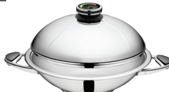
KEPTUVĖ „WOK“ Z-W3045 Ø 30 cm, 4.5 l, aukštis 9 cm Ø 11 ¾ col., 4.77 Qt, aukštis 3 ¾ col.