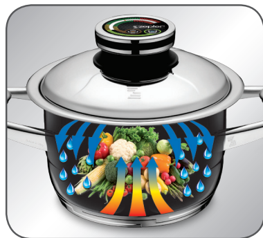
5 pav. „Zepter“ uždariusis ratas