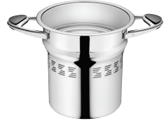
SPAGEČIŲ KOŠTUVAS Z-SR20 Ø 20 CM, 6 L, AUKŠTIS 21.7 CM Ø 7 ¾ COL., 6.36 QT, AUKŠTIS 8 ¾ COL.