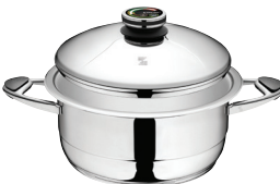
PUODAS Z-2875 Ø 28 cm, 7.5 l, aukštis 12.5 cm Ø 11 col., 7.5 Qt, aukštis 5 col.