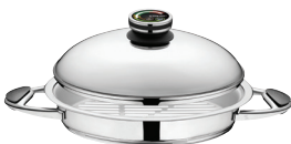
KEPSNINĖ Z-V3025Z 30 x 22 cm, 2.5 l, aukštis 5 cm Ø 11 ¾ col., 2.65 Qt, aukštis 2 col.