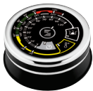
SKAITMENINIS RADJO TERMOREGULIATORIUS Z-DTC