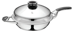
KEPTUVĖ, URA technologija Z-FP2838-LSC Ø 28 cm, 3,8 l, aukštis 6,5 cm Ø 11 col., 4,03 Qt, aukštis 2 ¾ col.