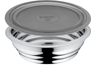
DUBUO Z-CB24 Ø 24 cm, 3 l, aukštis 8.7 cm Ø 9 ½ col., 3.18 Qt, aukštis 2 ¼ col. SU DANGČIU Z-CBL24 - Ø 24 cm