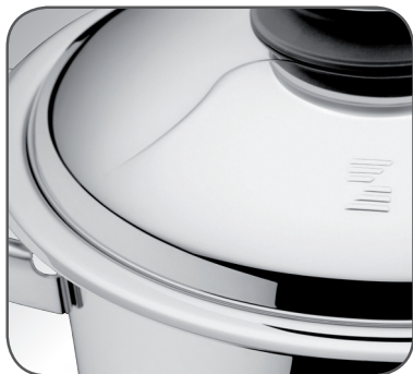
2 pav. „Zepter“ dangtis ir puodo kraštas