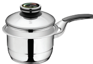
PADAŽŲ PUODAS Z-1620-SC Ø 16 cm, 2.0 l, aukštis 10 cm Ø 6 ¼ col., 2.12 Qt, aukštis 4 col.