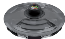
SYNCRO CLIK Z-420-24 Ø 24 cm, aukštis 10 cm Ø 9 ½ col., aukštis 4 col.