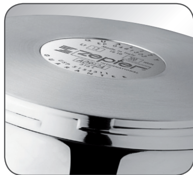
1 pav. „Zepter“ šilumą sulaikantis kompaktiškas dugnas (ZAC)

Prieš naudodami, atidžiai perskaitykite šią instrukciją.