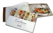
GAMINIMO KNYGA - PMH-142-10