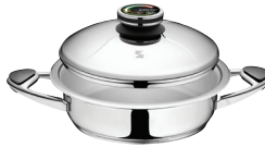
KEPTUVĖ, URA technologija Z-2430 Ø 24 cm, 3.0 l, aukštis 6.8 cm Ø 9 ½ col., 3.18 Qt, aukštis 2 ¾ col.