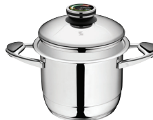
PUODAS Z-2050 Ø 20 cm, 5 l, aukštis 16.3 cm Ø 7 ¾ col., 5.30 Qt, aukštis 6 ¼ col.