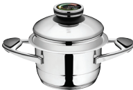
PUODAS Z-1620 Ø 16 cm, 2.0 l, aukštis 10 cm Ø 6 ¼ col., 2.12 Qt, aukštis 4 col.