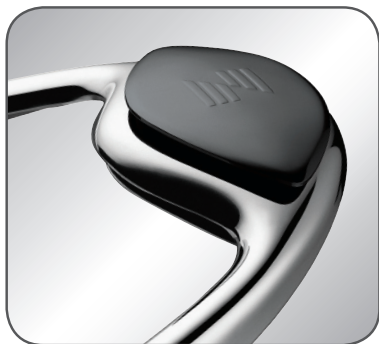
4 pav. „Zepter“ rankenos