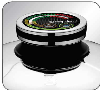
3 pav. „Zepter“ termoreguliatorius