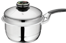
PADAŽŲ PUODAS Z-2030-SC Ø 20 cm, 3 l, aukštis 9.7 cm Ø 7 ¾ col., 3.18 Qt, aukštis 3 ¾ col.