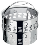
GARŲ KREPŠELIŲ SISTEMA Z-420-18 Ø 18 cm, 4.0 l, aukštis 14 cm Ø 7 col., 4.24 Qt, aukštis 5 ½ col.